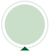
Berenike Waubert de Puiseau